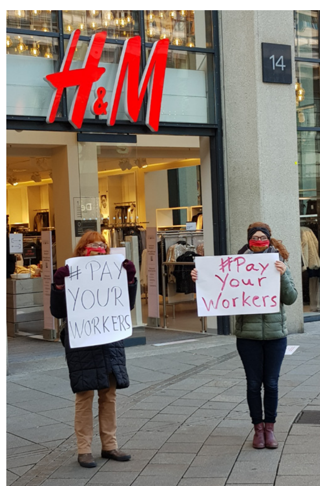
#payyourworkers-Aktion in Stuttgart

Einmal im Jahr treffen sich Aktivist*innen, Multiplikator*innen sowie Interessierte der Kampagne für Saubere Kleidung, informieren sich über die aktuellsten ARBEITSBEDINGUNGEN IN DER GLOBALEN MODEINDUSTRIE und probieren sich in verschiedenen Aktionsformen aus. Im Fokus stehen dabei die Fragen: Wie machen wir andere auf die desaströsen Arbeitsbedingungen von Textilarbeiter*innen aufmerksam? Was fordern wir von Modeunternehmen und Politiker*innen?