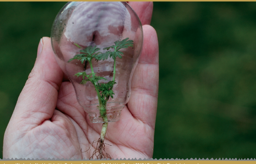
Lange Woche der Nachhaltigkeit in Sachsen-Anhalt vom 25. Mai bis 10. Juni 2019