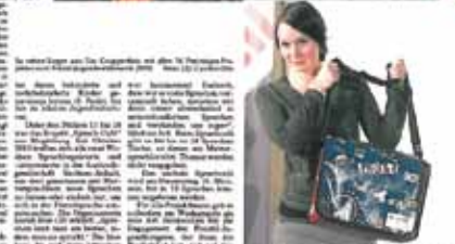
Die Magdeburger „Sprachlos im Sprach-Café“ – das ist das Motto des 1. Projekts zum 20. Jubiläum beim Festival der Kulturen & Jugendengagement. In der Jugendherberge Dessau werden alle Teilnehmer des Eurocamps 2010 erwartet, von der Jugendherberge bis zum Schlosspark.

„Sprachlos im Sprach-Café“ – das ist das Motto des 1. Projekts zum 20. Jubiläum beim Festival der Kulturen & Jugendengagement. In der Jugendherberge Dessau werden alle Teilnehmer des Eurocamps 2010 erwartet, von der Jugendherberge bis zum Schlosspark.